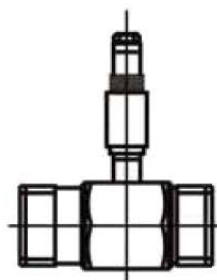
DN15 ~ DN50